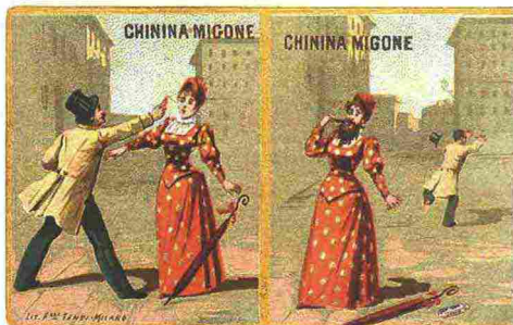
Effetti dell'Acqua di Chinina, fine Ottocento - Figurina acqua chinina Migone